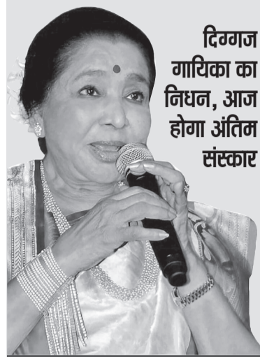
जन्म- 08.09.1935 निधन-12.04.2026

अपनी अनूठी आवाज से हिंदी पार्श्व गायन में अलग मुकाम हासिल करने वाली दिग्गज गायिका आशा भोसले का रविवार को निधन हो गया। वह 92 वर्ष की थीं। उन्होंने अपनी बहन तथा महान गायिका लता मंगेशकर की छाया में रहकर अपनी अलग पहचान बनाई थी।